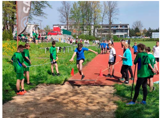
Skok w dal

28 kwietnia stadion sportowy LKS Bestwina gościł małe igrzyska, w których startowali uczniowie szkół z Kaniowa, Bestwinki i Bestwiny. Zawody przeprowadzono pod znakiem „królowej sportu”, jaką jest oczywiście lekkoatletyka. Klasy 4–6 wzięły udział w specjalnym czwórboju, a 7–8 w osobnych zawodach. Nad prawidłowym przebiegiem zmagania czuwali nauczyciele wychowania fizycznego.