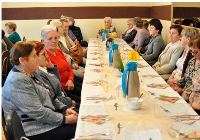
Członkinie KGW w Bestwinie

Liczba członkiń Koła w dniu zebrania wynosiła 52 osoby – wzorem innych kół panie planują rozszerzyć swoją ofertę także dla dzieci i młodzieży, by móc komu przekazać swoje