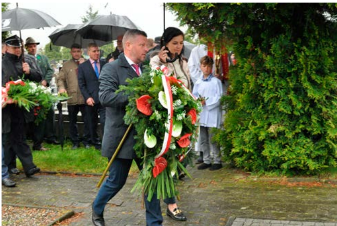
Składanie wieńców pod pomnikiem