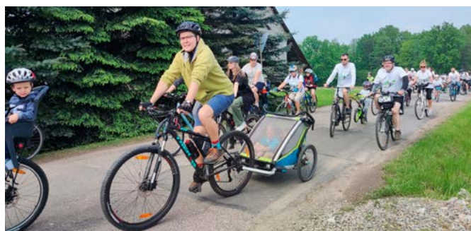
Na trasie rajdu