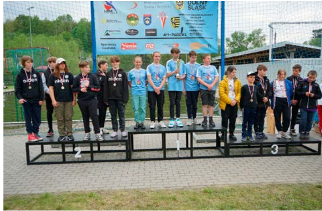
Młodzicy na podium w Leśnej

Jedno – drugie i trzy – trzecie miejsca – oto bilans występów drużyn UKS Set Kaniów na zawodach, jakie odbywały się w Szczecinie (6–7 maja) i w Leśnej (13–14 maja). Przed występami na kaniowskich wodnych boiskach takie wyniki napawają optymizmem i potwierdzają, że nagrody otrzymane na powiatowym spotkaniu środowisk sportowych były ze wszelkich miar zasłużone. Zawodnikom, zawodniczkom, trenerom i kierownictwu klubu składamy serdeczne gratulacje!