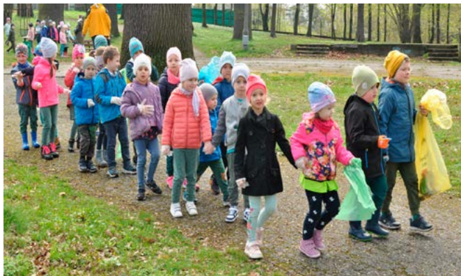
Przedшкоlaki z Bestwiny sprzątają park starodrzewia