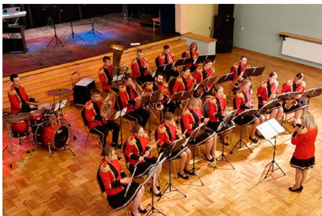
Młodzieżowa Orkiestra Dęta, „Con Fuoco Band”