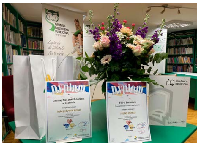
Dyplomy uzyskane przez bibliotekę

Równocześnie przypominamy, że filia biblioteczna w Kaniowie działa w nowej lokalizacji. Księgozbiór jest dostępny w dawnym Ośrodku Zdrowia przy ul. Batalionów Chłopskich 50.