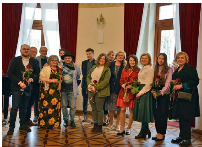
W Pałacu Czeczów w Kozach