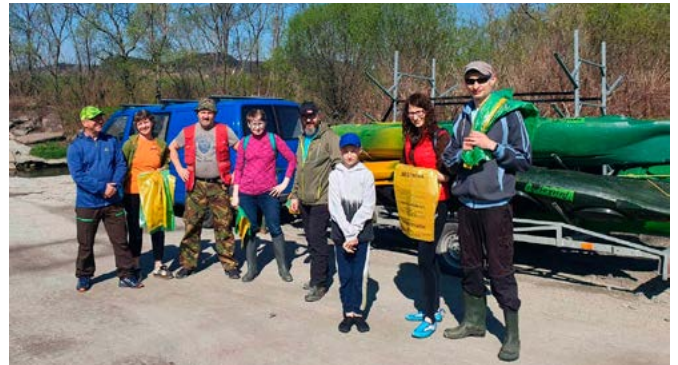
Uczestnicy sprzątania Wisły