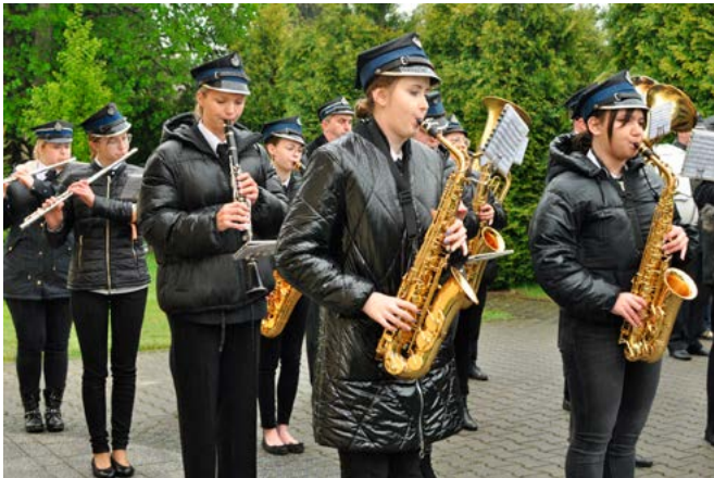
Hymn odegrała Orkiestra Dęta Gminy Bestwina z siedzibą w Kaniowie

Defilowały poczty sztandarowe strażaków, górników, Koła Łowieckiego, Koła Pszczelarzy, placówek oświatowych, Regionalnego Zespołu Pieśni i Tańca Bestwina. Razem z nimi szli radni, sołtysi i członkowie Rad Sołectkich, organizacje, stowarzyszenia, kluby i mieszkańcy, kierowani