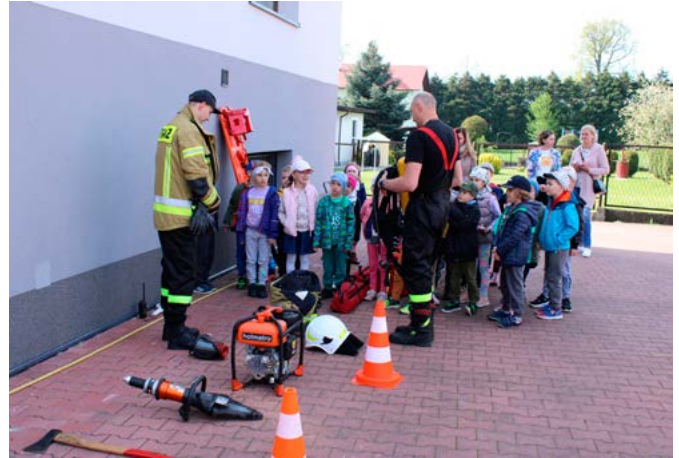
Najmłodszy oglądają wyposażenie strażnicy

Możliwości pomocy strażakom jest wiele. W maju można ich spotkać pod kościołami, gdzie urządzają kwestę. W okresie świąteczno-noworocznym rozprowadzają kalendarze. Chętni mogą przekazać 1% podatku na OSP jako organizację pożytku publicznego.