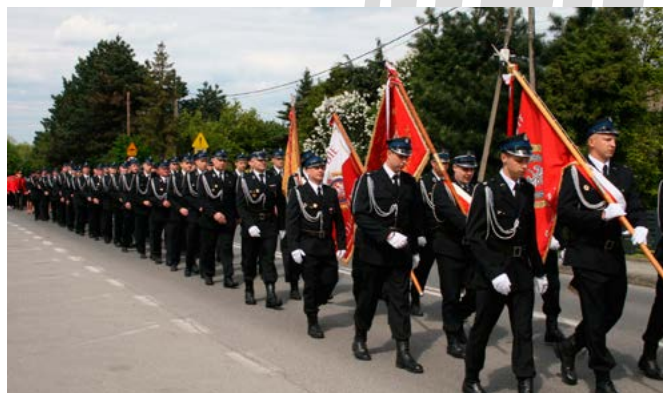
Defilada ulicami Kaniowa

Do tradycyjnych elementów obecnych podczas każdej akademii należą: przegląd pododdziałów, podniesienie flagi państwowej, przemówienia zaproszonych gości i przyznanie odznaczeń pożarniczych. Tak też było w Kaniowie. Na szczęście dopisała pogoda i świętowano w pięknej, wiosennej scenerii.