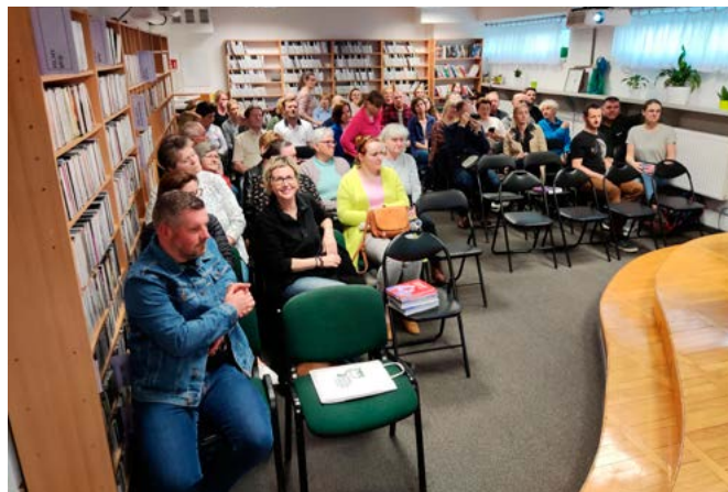
Miłośnicy podróży obecni na spotkaniu

Gość biblioteki nawiązał z publicznością żywy kontakt, odpowiadał na liczne pytania. Wspominał o wyprawach z roku 1995, kiedy to w ciągu jednego roku osiągnął oba bieguny, wyprawę z Janem Melą, dotarcie do źródeł Amazonki, przepłynięcie Atlantyku i pieszą