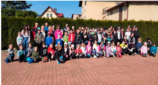
Sprzątanie w Bestwinie - uczestnicy akcji