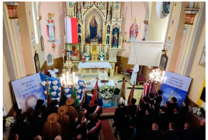
Msza św. w intencji Ojczyzny

cierpiały nie tylko podczas bezpośrednich działań zbrojnych, ale także poza nimi w wyniku represji i prześladowań.