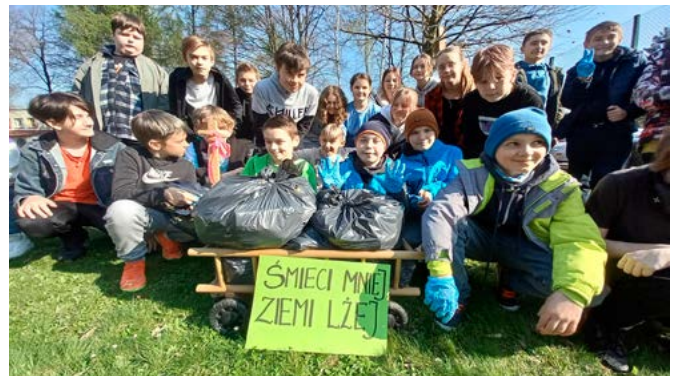
Uczniowie z Kaniowa