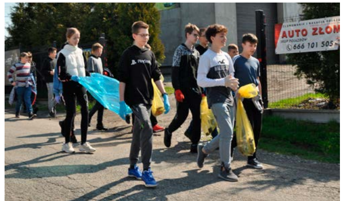
Sprzątanie w Janowicach

Szlaki sprzątającym przetarły bestwińskie przedszkolaki, które udały się do parku przy Urzędzie Gminy – pałacu Habsburgów. Później na ulice i tereny zielone wyruszyli uczniowie szkół podstawowych wraz z nauczycielami zbierający odpady zalegające w wyznaczonych rejonach. Na uwagę zasługuje akcja sobotnia w sołectwie Bestwinka. Ochotnicza Straż Pożarna, Koło Gospodyń Wiejskich i szkoła połączyły siły zapraszając do przyłączenia się wszystkich chętnych. Oprócz dzieci i młodzieży odpowiedziały również osoby dorosłe, w tym także radni i członkowie Rady Sołectkiej.