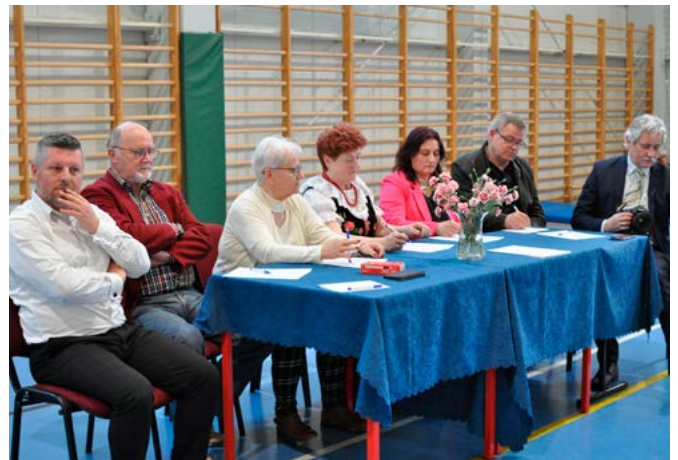
Jurorzy turnieju klas