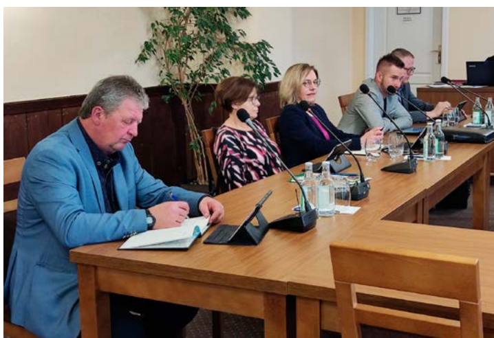
Podejmowanie uchwał i dyskusja