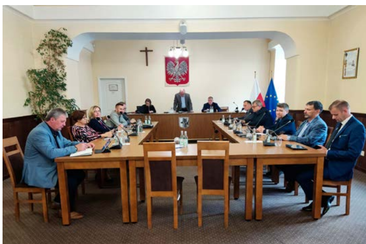
Radni zgromadzeni na sali sesyjnej

W ramach dyskusji i wolnych wniosków poruszona została kwestia wyznaczenia osobnego dzielnicowego dla sołectw Be-