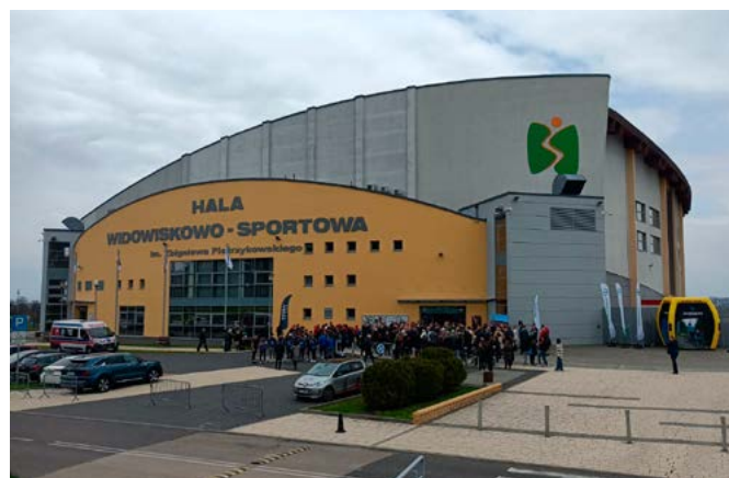
Hala widowiskowo-sportowa w Bielsku-Białej

jący podsumował wydarzenie: Tradycje sportowe w naszej gminie są długie i jestem bardzo dumny, że ich częścią są dokonania Zbigniewa Pietrzykowskiego. Jego imię otrzyma wkrótce także szkoła podstawowa w Bestwinie. Z tej miejscowości pochodzi także inny znany olimpijczyk, złoty medalista w podnoszeniu ciężarów, Zygmunt Smalcerz. Mam nadzieję, że postać Zbigniewa Pietrzykowskiego zainspiruje młodzież – i nie tylko – do podążania jego śladem, niekoniecznie w boksie, ale na przykład w kajak-polo, w piłce nożnej, w tenisie stołowym, w judo... – możliwości, dzięki naszym klubom i szkołom, jest bardzo dużo.