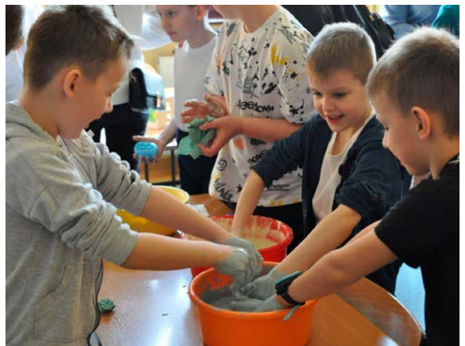
Eksperymenty w salach lekcyjnych