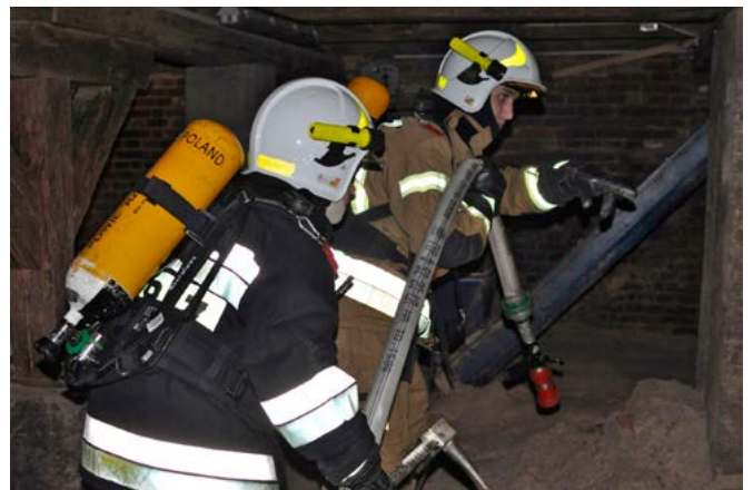
Działania w piwnicy bestwińskiego tartaku

do piwnicy, by tam odszukać stwarzające niebezpieczeństwo butle i wynieść pracowników wcielających się w rolę uszkodzonych. Przy okazji ekipa ratownicza trenowała resuscytację, co także jest stałym elementem różnych ćwiczeń i zawodów.