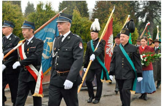
Przemarsz pocztów sztandarowych