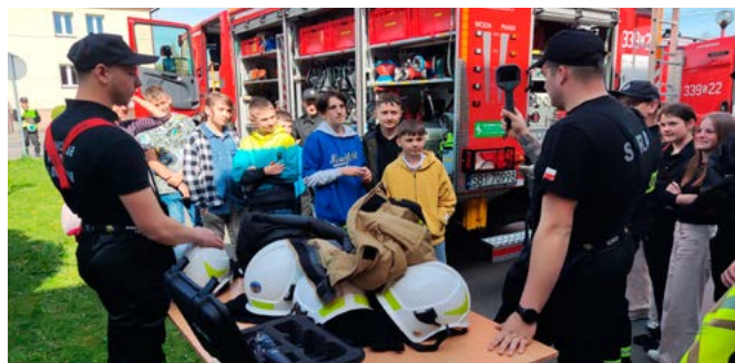
Prezentacja sprzętu i umundurowania

Wielokrotnie zwracaliśmy uwagę na to, jak bardzo różnorodna jest działalność strażaków. Likwidacja pożarów i innych zagrożeń miejscowych to jedno; ogromny nacisk kładzie się dziś na ratownictwo: medyczne, techniczne, wodne, lodowe. Dzięki kursom i szkoleniom druhowie i drużyny nabywają stosowne umiejętności, sprawdzane później na specjalistycznych zawodach, z których przywożone są medale i puchary.