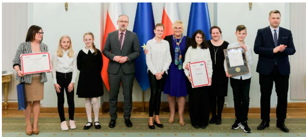
Odbiór nagrody z udziałem ministrów