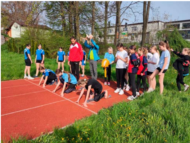
Start do biegu