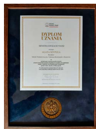
Dyplom dla szkoły w Kaniowie