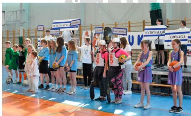
Prezentacja sportowych talentów

Na podsumowanie całości złożył się synchroniczny taniec uczniów (ćwiczone na „aktywnych przerwach”) i podziękowania dla każdego, kto poświęcił swój czas na przygotowanie tego wyjątkowego dnia